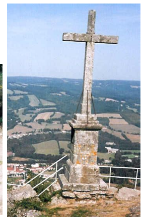
Croix de la Roque