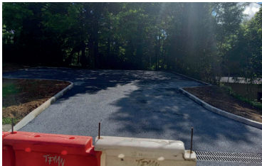
Création d'un parking au terrain de pétanque