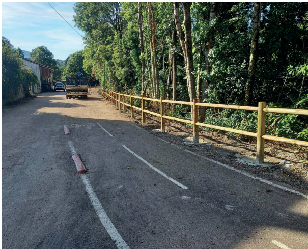
Installation de barrières de sécurisation de la voie verte