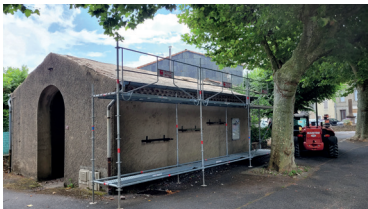
Réfection du lavoir