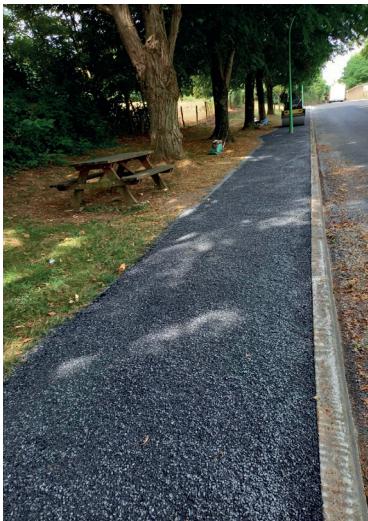
Trottoir du parking du Caoussadou