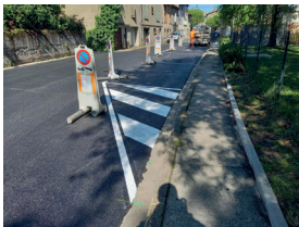
Marquages au sol repeints