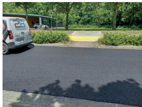
Goudronnage de la rue du portail haut jusqu'à la salle des sports