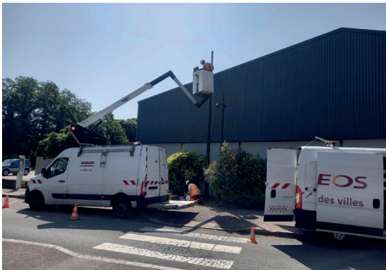
Installation de nouvelles Caméras (parking école Interligne-MJC-ZI)