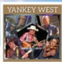
Yankey West Dimanche 18h

Orchestres "payant" vendredi - samedi - dimanche